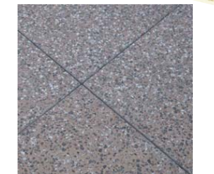
車道は御影石風ベアコート▲