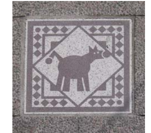
シンボルの絵柄を路面に▲