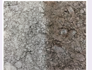
▲右側がペネプライマーを 散布した路盤