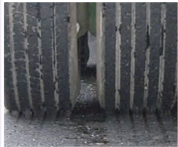
▲通常のタックコート用乳剤の状況 (タイヤへの付着あり)