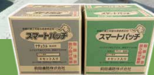
〈製品荷姿〉左：ナチュラル色、右：ブラック色