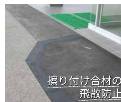
擦り付け合材の 飛散防止