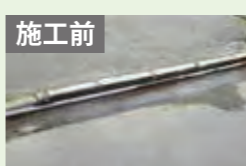
つまづきの原因となる段差は危険です。