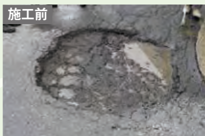
水たまりにもそのまま施工可能です。