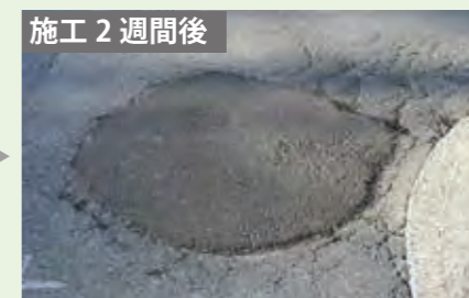
施工直後から硬化は良好です。