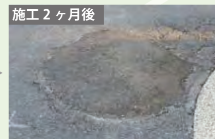
大型車の通行が多い場所でも舗装の傷みはありません。