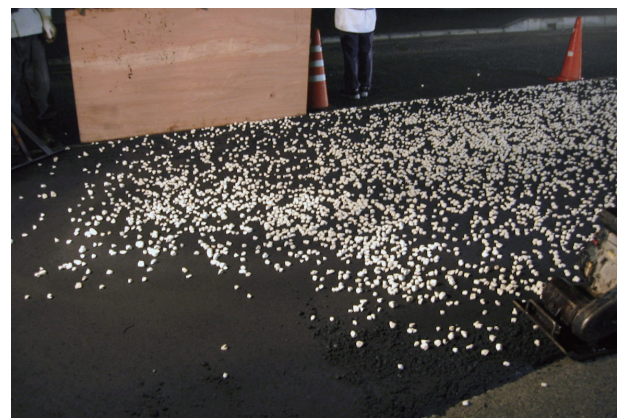
施工状況（有色骨材散布）