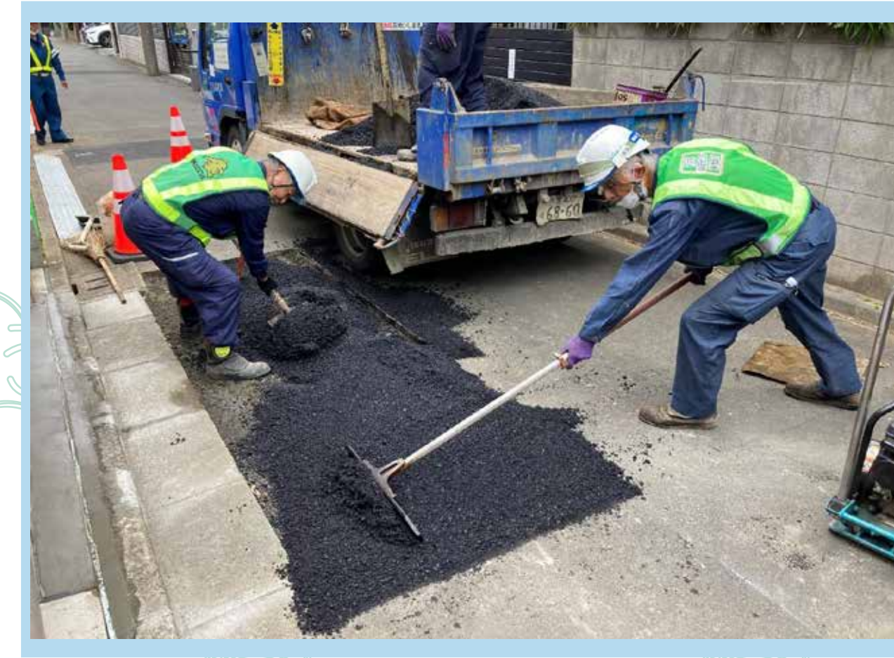
〈効率的な舗装の補修・修繕〉