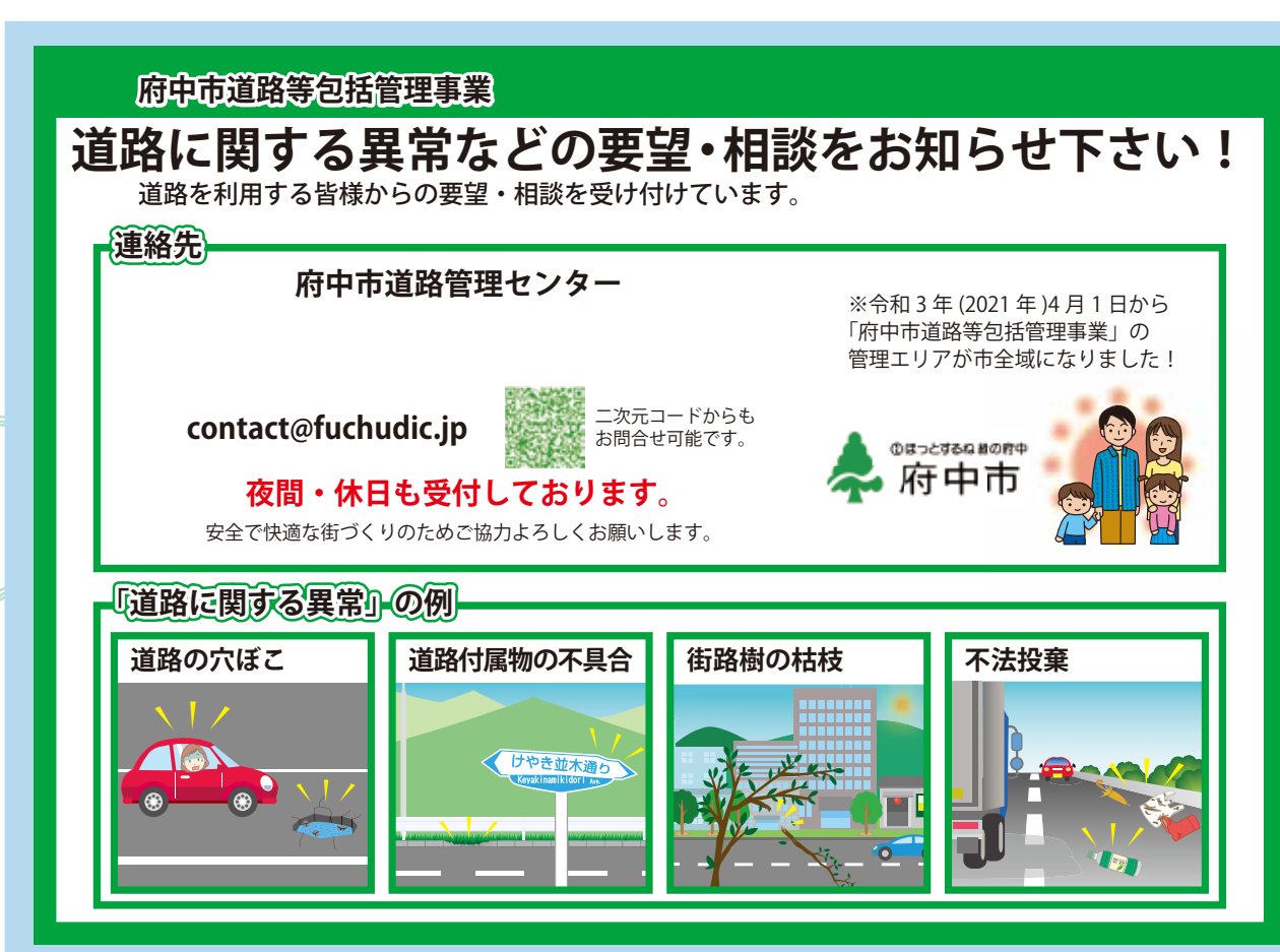
〈事業の広報チラシ〉