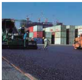
開粒度アスファルト混合物の施工