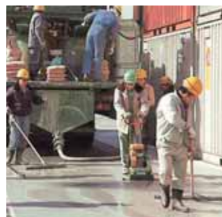
ベアコートミルクの浸透作業