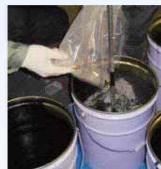
砂・石粉、硬化材の添加・混合