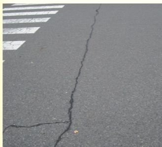
クラック補修(ブラック)