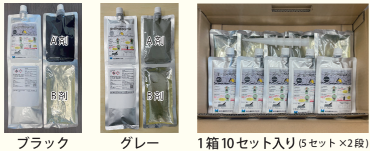
ブラック グレー 1箱10セット入り(5セット×2段)

2in1 パッケージにより常温で簡単に施工可能で、長期にわたり高い防水性を有するポリウレタン系ひび割れ補修材です。 1 セットは 400mL です。色はブラックとグレーの 2 色で、使い分けが可能です。